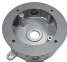
ベースケース (シリコンゴムブッシュ付)